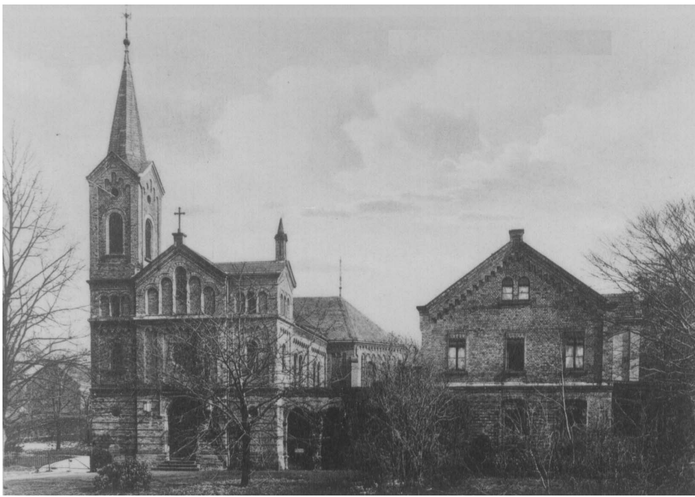
Kirche und Pfarrhaus