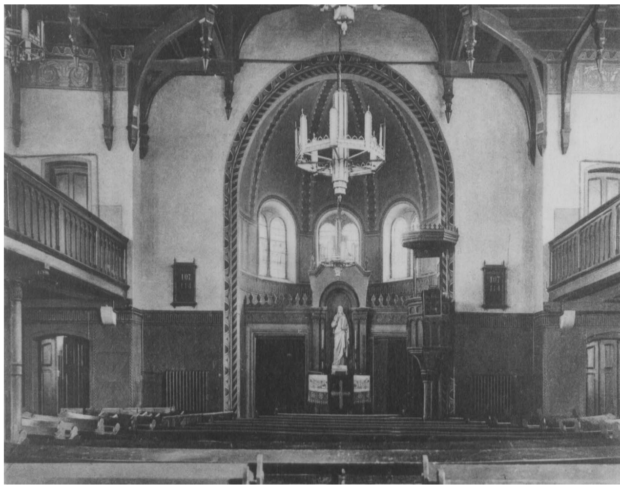
Der alte Innenraum