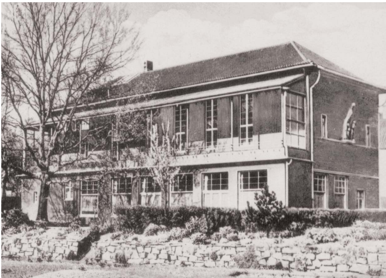
Der alte Marien - Kindergarten