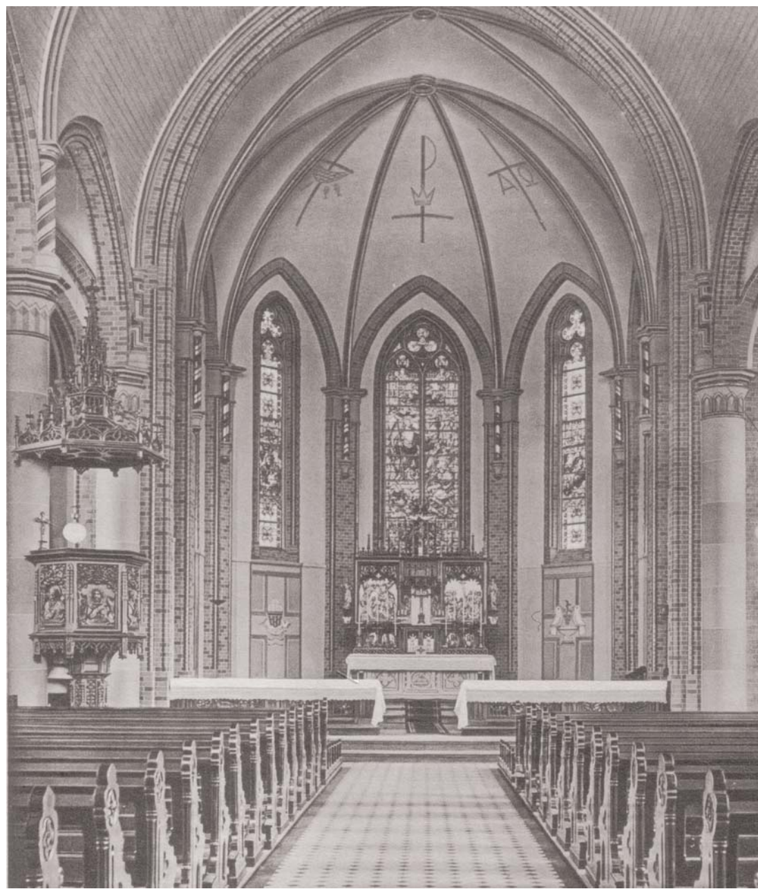
Der ehemalige Chor der St. Josef Kirche