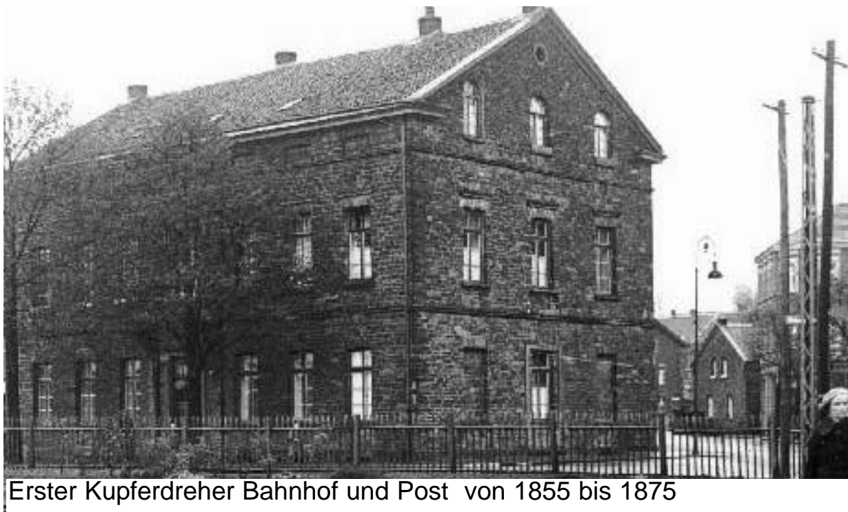
Erster Kupferdreher Bahnhof und Post von 1855 bis 1875