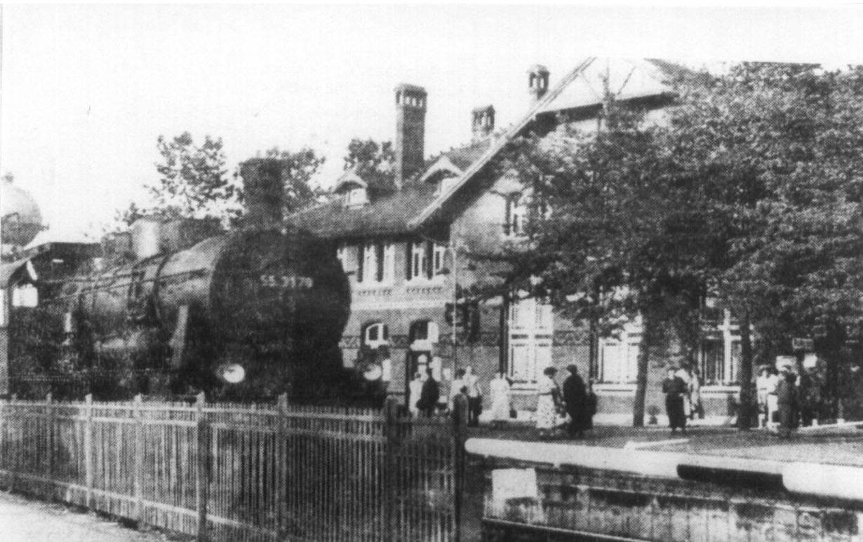
Königlich Preußischer Bahnhof zu Kupferdreh, von 1898 bis 1967