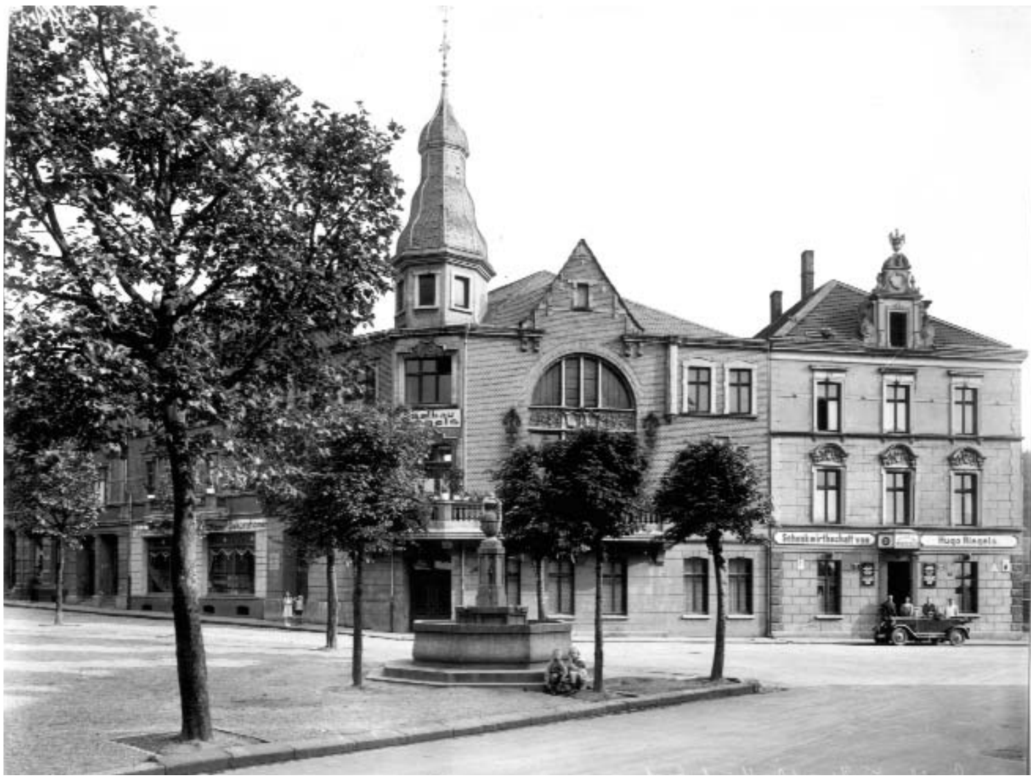
Saalbau Riegels und Marktbrunnen