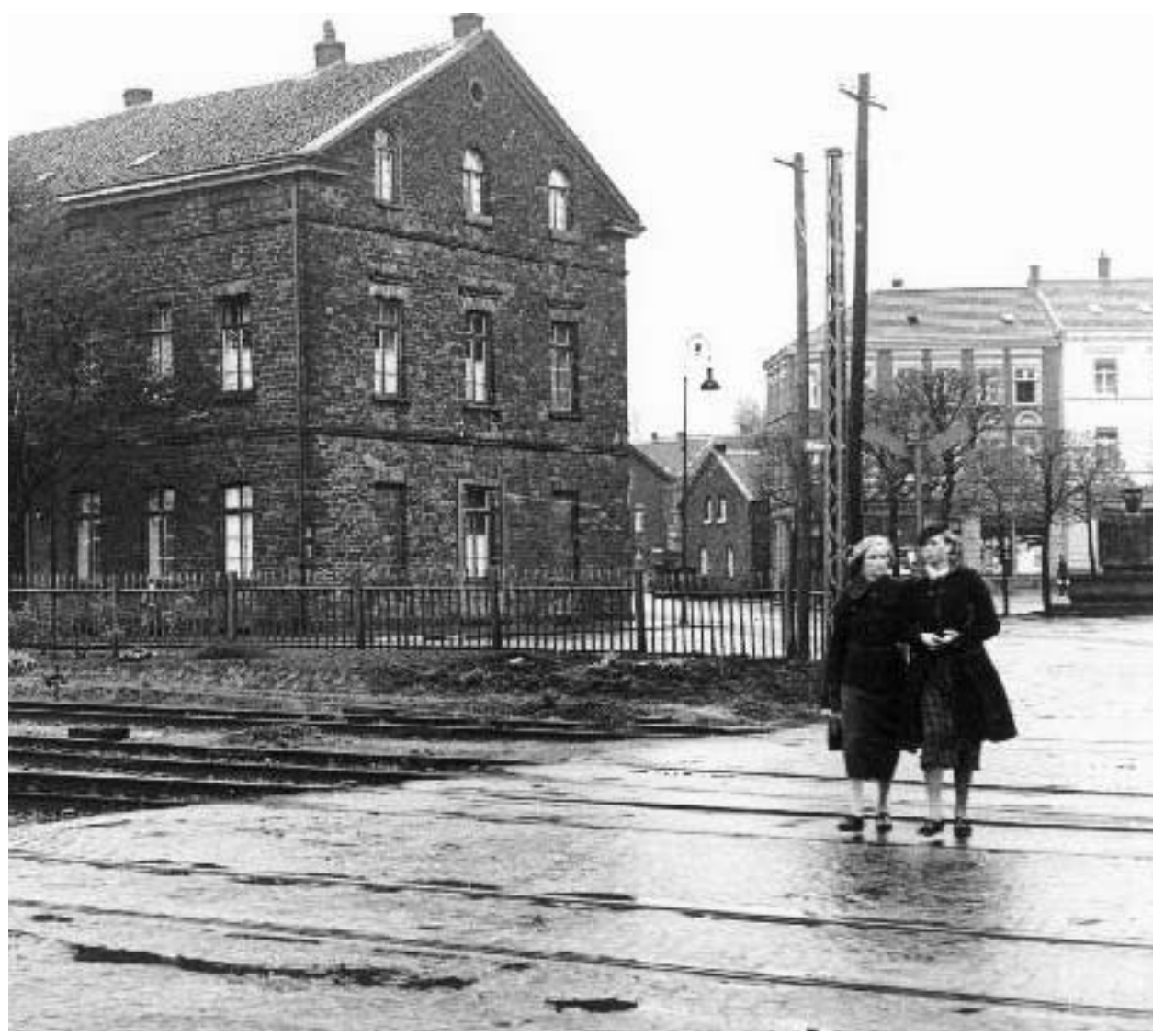
Bahnhof Kupferdreh von 1855 bis 1875